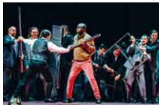
Nabucco, 2018

Tickets & Infos: 07321/327 7777 oder www.opernfestspiele.de